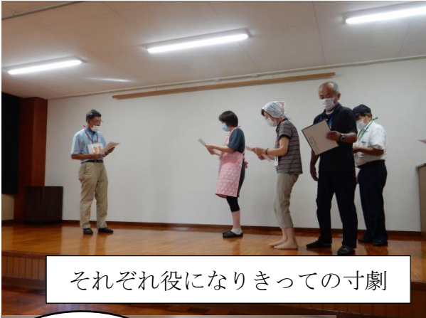
それぞれ役になりきっての寸劇