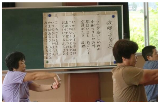
腕を伸ばし手の甲をゆっくり引っ張る

7月1日・8日（水） 4ヶ月ぶりの堀川先生 の体操です。リラックスして 身体をほぐしました。