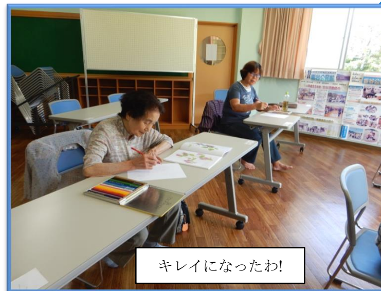
キレイになったわ!