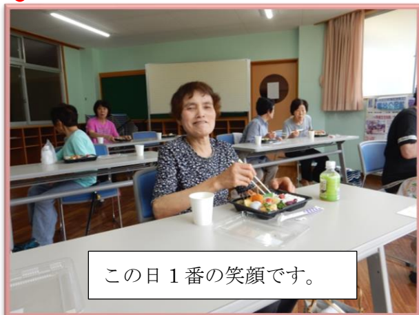
この日1番の笑顔です。