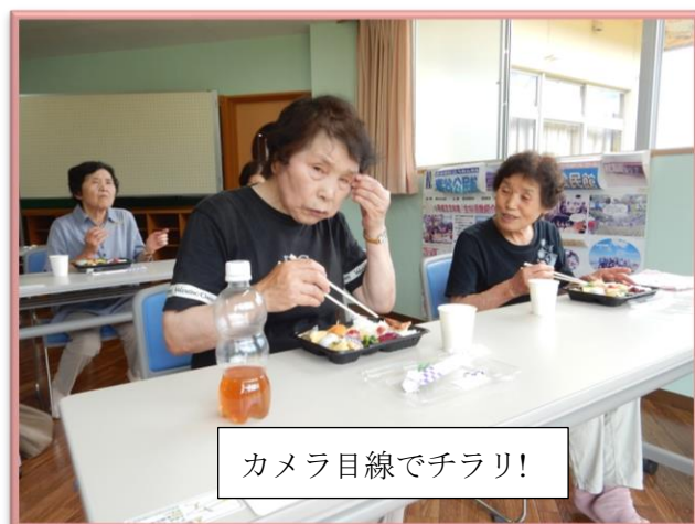
カメラ視線でチラリ!