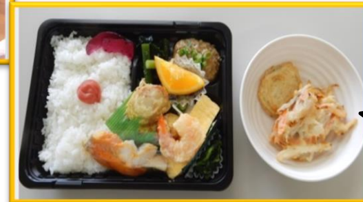
今日のメニュー お弁当 杉本さん手作りの の天ぷら