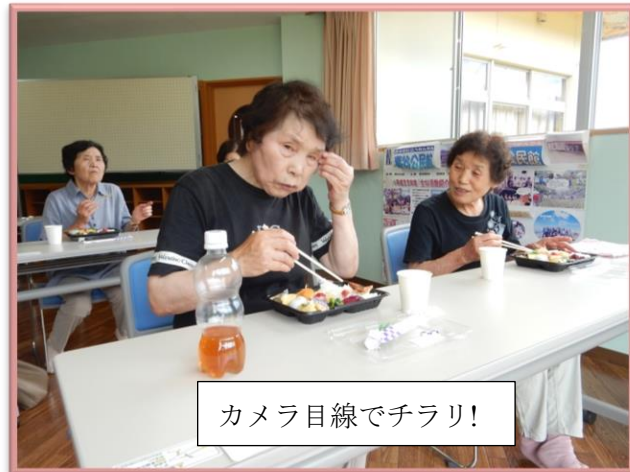
カメラ目線でチラリ!