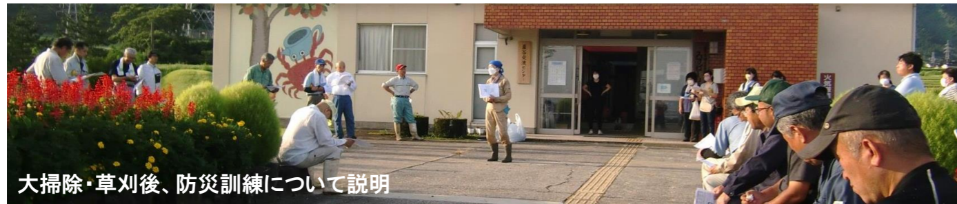
大掃除・草刈後、防災訓練について説明