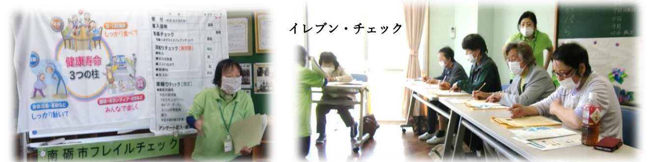
イレブン・チェック